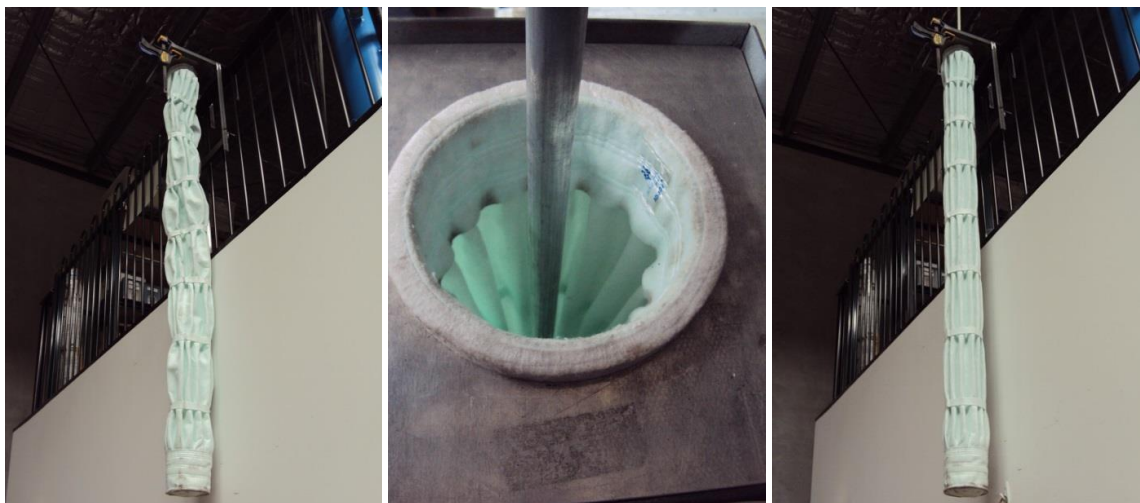
Figura 3: Uma pequena força aplicada na haste de instalação alinhará as plissas e deixará a manga pronta para a inserção da gaiola.