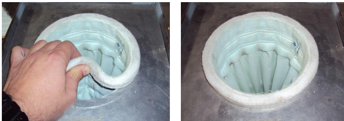
Figura 2. Manga encaixada na placa espelho.