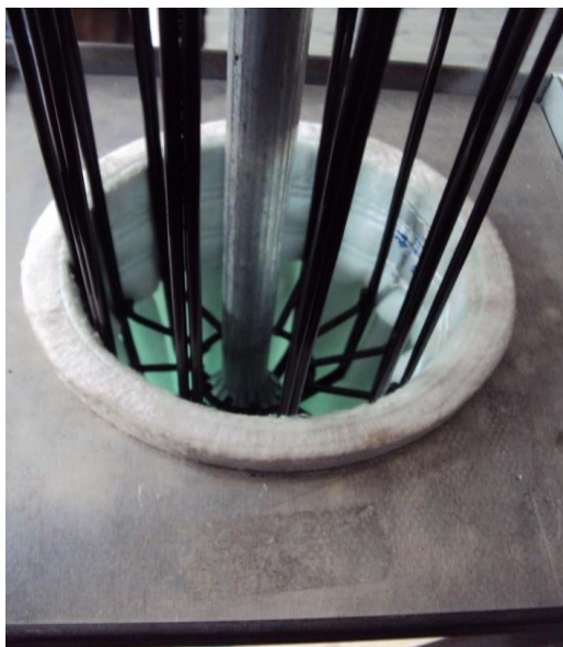
Figura 4: plissas alinhada com as longarinas da gaiola.