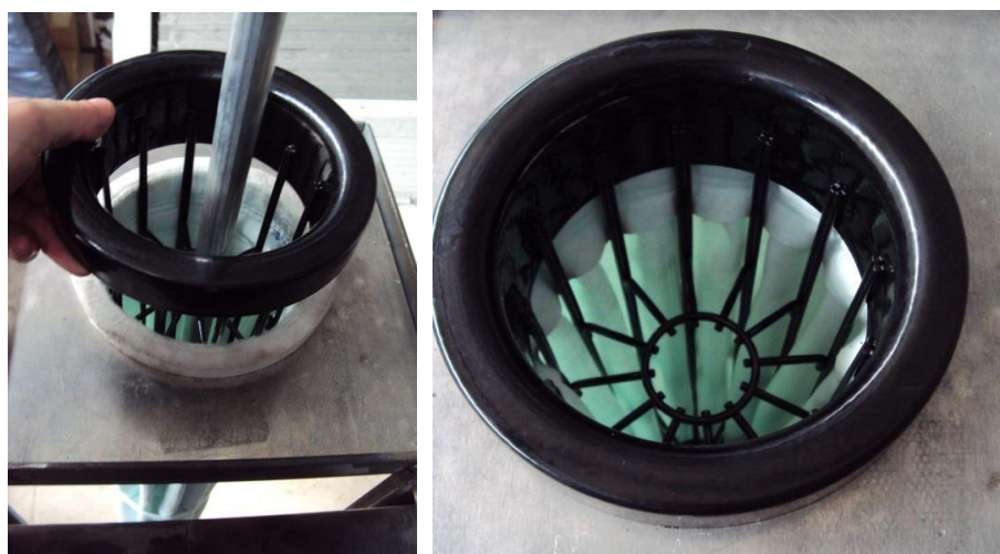
Figura 5: Final da instalação